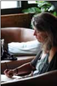
Dessin Isabelle Ecklin, Jazz sous les Étoiles 2019